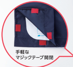
手軽な マジックテープ開閉 開き口があるので、 容量確認や 排尿処理が容易