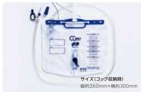
サイズ(コック収納時) 縦約260mm×横約300mm