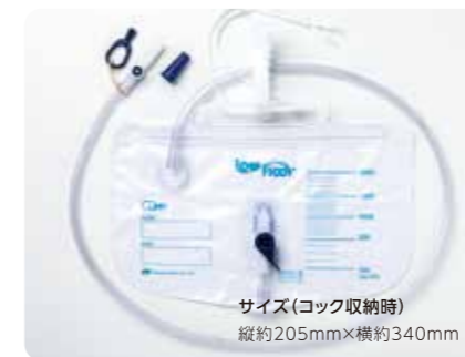
サイズ(コック収納時) 縦約205mm×横約340mm