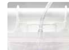
平行に吊り下げ可能な脱 着フック