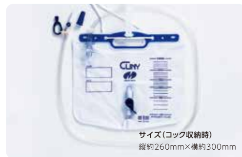
サイズ(コック収納時) 縦約260mm×横約300mm