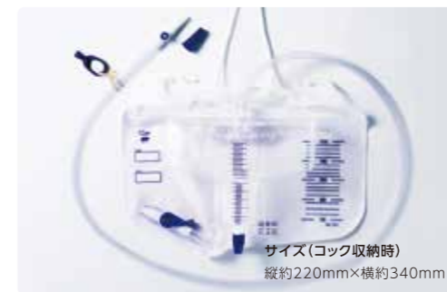
サイズ(コック収納時) 縦約220mm×横約340mm