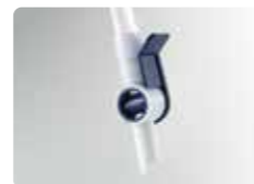
片手で容易に排尿可能な コックハンドル