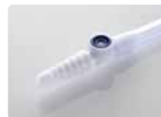
針が不要なニードルレス サンプルポート