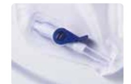
片手で容易に排尿可能な コックハンドル