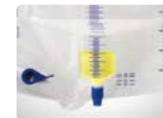
50mL以下は1mL刻みで 表示