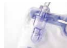
逆流しにくい2層式ドリッ プチャンバー