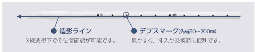
オールシリコンフォーリーカテーテル (先端開口タイプ) 小児用 透明タイプ