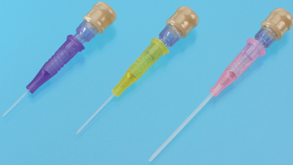
※ティアレ動物用留置針との接続例